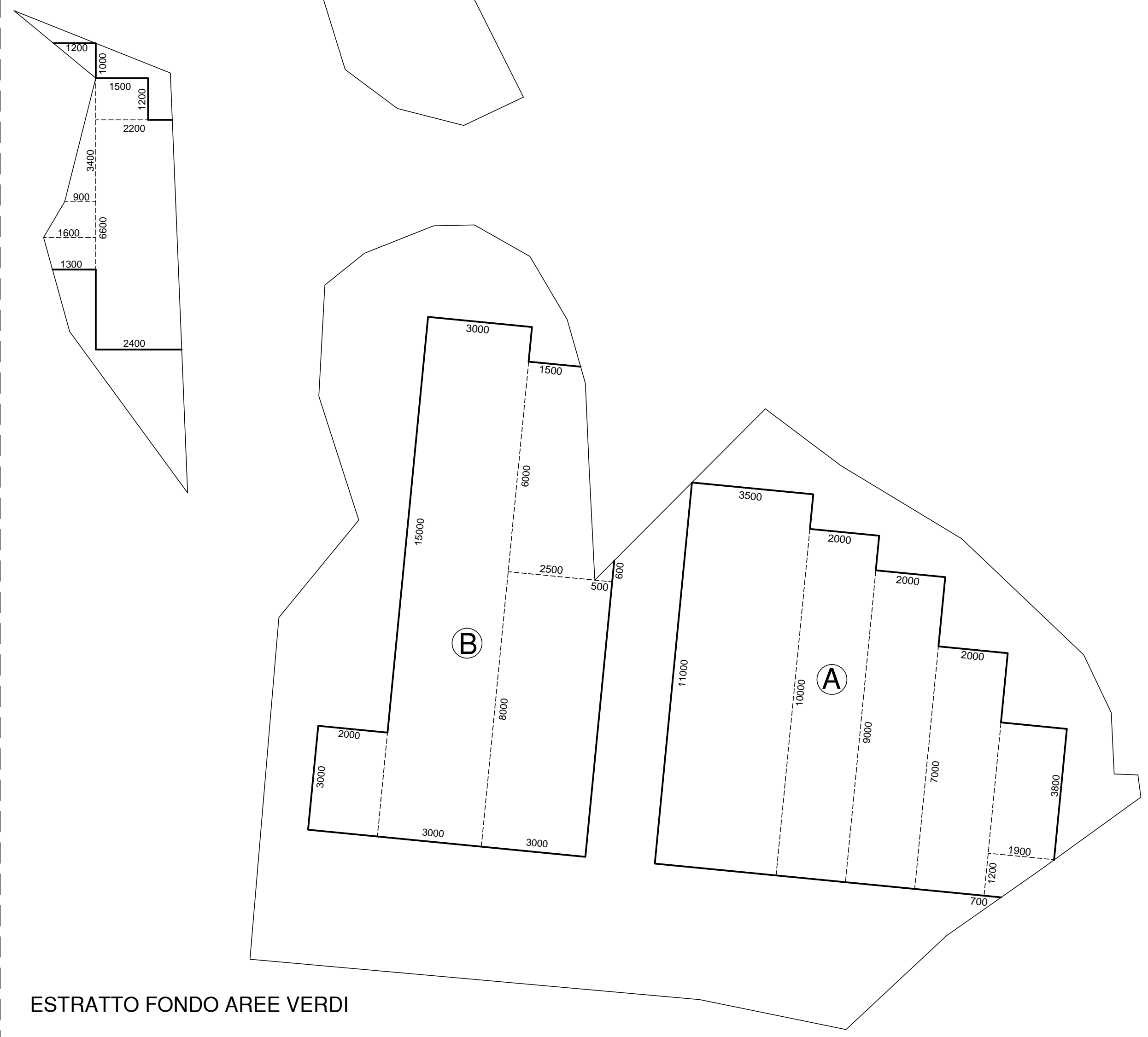
ESTRATTO FONDO AREE VERDI

SCHEMA CALCOLO S.L.P. PORZIONI DI FABBRICATI INSERITI NEL PERIMETRO "AREE VERDI" E SOGGETTA ALLA MAGGIORAZIONE DEL 5% DEGLI ONERI DI URBANIZZAZIONE